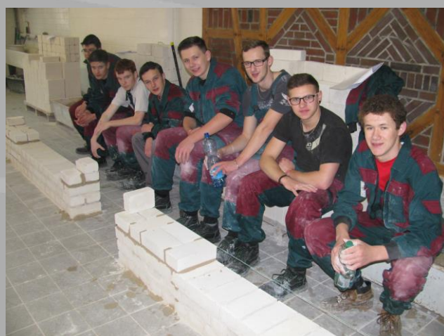
(Stáž žáků v Německu v rámci projektu Leonardo 2015)