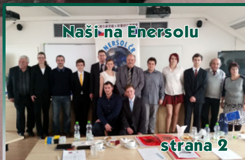
Naši na Enersolu